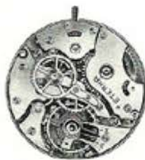
cal. 520 S seconde au centre